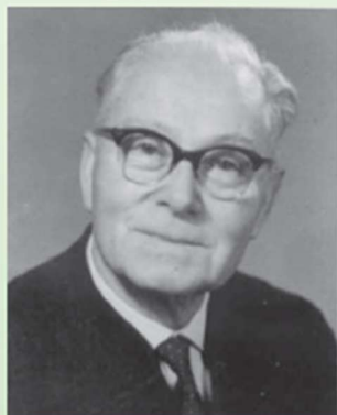
EMIL PACHMAYR Ehem. Weltmeister und viormaliger Deutscher Meister Ehrensützenmeister der FSG

Auf geht's zum 53. Emil Pachmayr KK-Gedächtnisschießen mit Mannschaftswettbewerb (Gewehr und Sportpistole) verbunden mit KK-Gaukönig 2026 und 25m KK-Sportpistolen Wettbewerb auf elektronischen Ständen im Schützenhaus Traunstein, Ettendorfer Weg 8